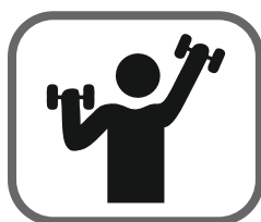
Активный образ жизни