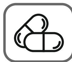
Витаминно-минеральные комплексы в эпидсезон